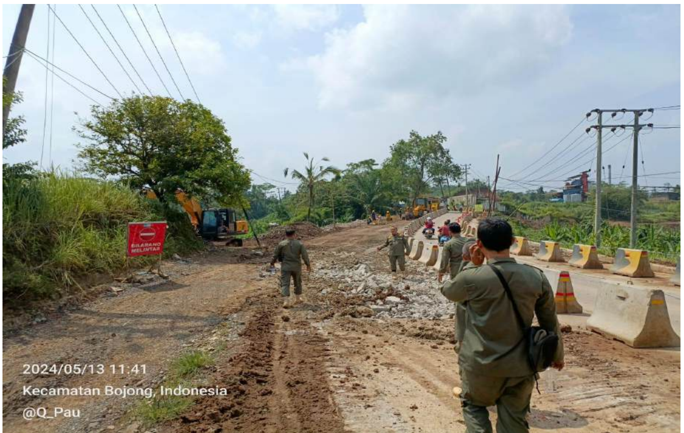
2024/05/13 11:41 Kecamatan Bojong, Indonesia @Q_Pau