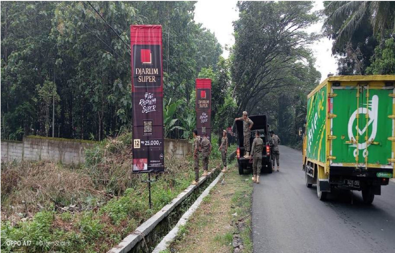
OPPO A17 · @DJoemStickers