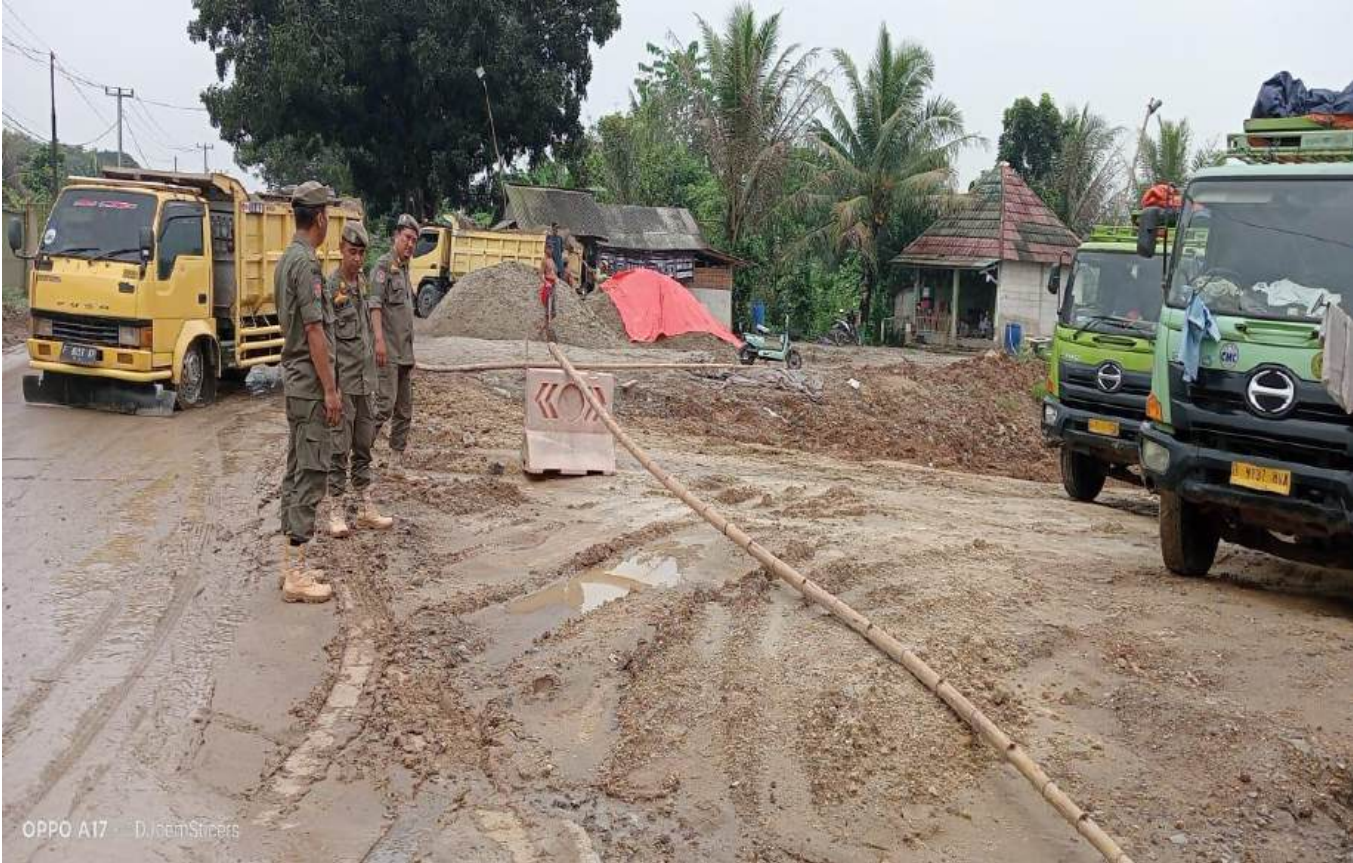
OPPO A17 · @DJoemStickers