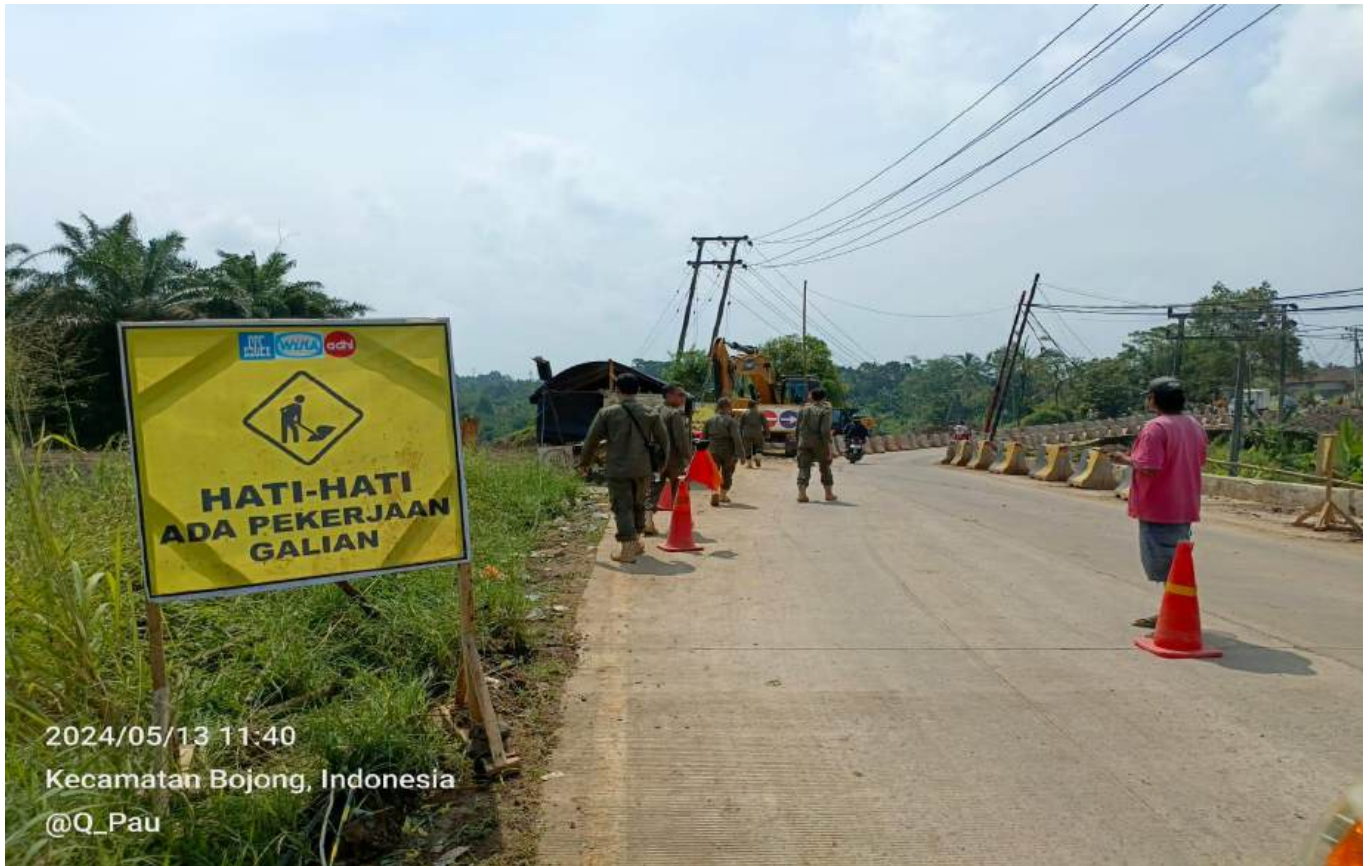
2024/05/13 11:40 Kecamatan Bojong, Indonesia @Q_Pau